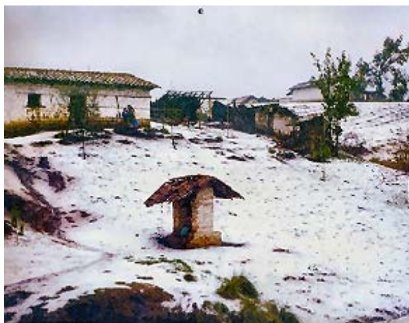
En la época fría, se observan escenas poco comunes en un país tropical.

Les nuits sont si froides ici que je mets mon sac de duvet par dessus les couvertures de laine!