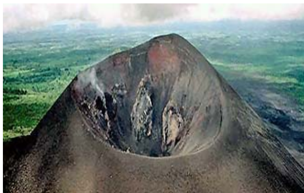
El Cerro Negro en León 'Espectacular cráter que cuando activa sus vísceras es un infierno total

Tout va bien ici. Nous sommes encore aujourd'hui à Leon, au Nicaragua du sud ouest.