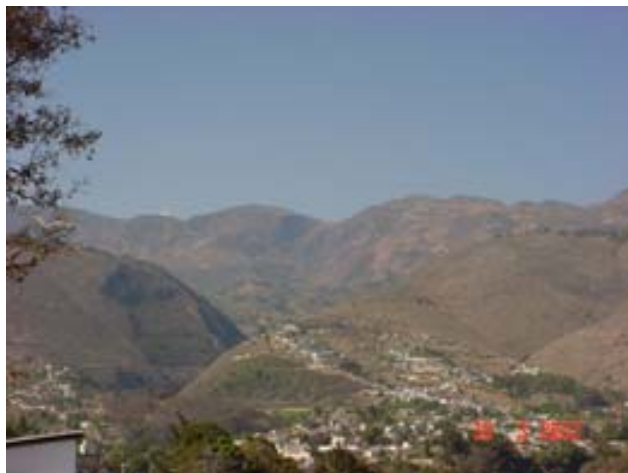
Los Cuchumatanes, vistos desde Buenos Aires

Pourtant, le lac d' Atitlan nous attire et les températures plus douces !