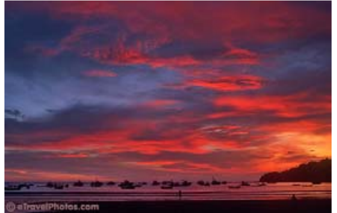
Coucher de soleil à San Juan Del Sur