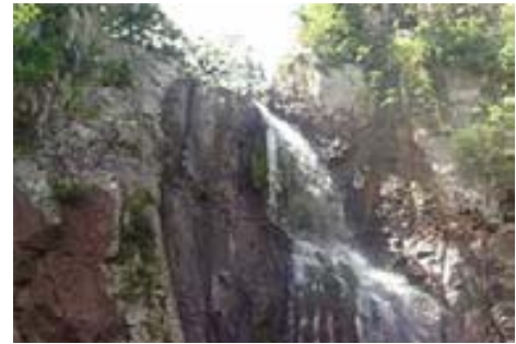
Esteli :Salto Estanzuela