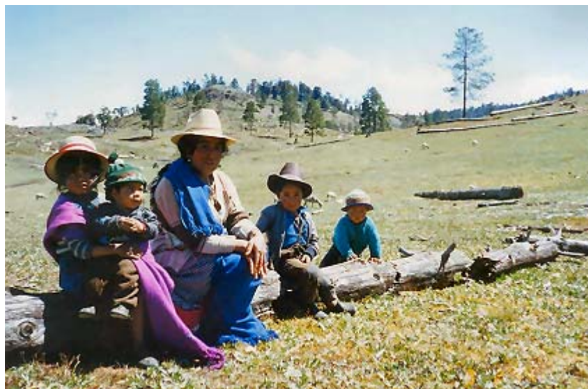
La gente sencilla de los Cuchumatanes (Guatemala)

(Traductions et illustrations faites par Robert kirsch@free.fr )