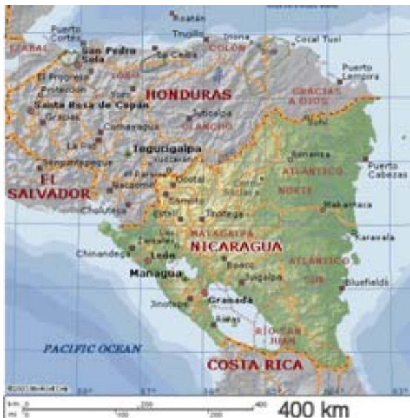
Relief du Nicaragua