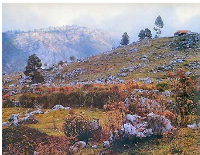
Detalle de la Sierra Cuchumatanes

Cette fois, nous sommes au Guatemala, après une traversée de frontière très facile. Nous avons décidé de partir dans un coin du sud ouest peu connu des touristes: les montagnes de Cuchumatanes, et le joli village de Todos Santos.