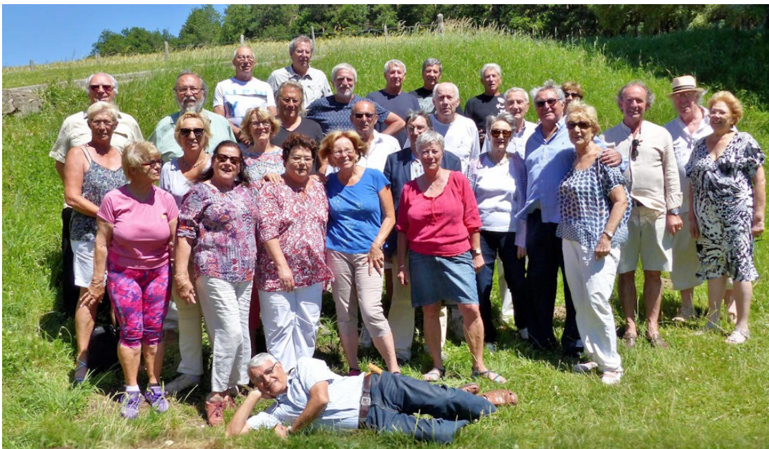
Retrouvailles de leurs petits-enfants avec conjoints, à Saint-Martin-en-Haut le samedi 17 juin 2017